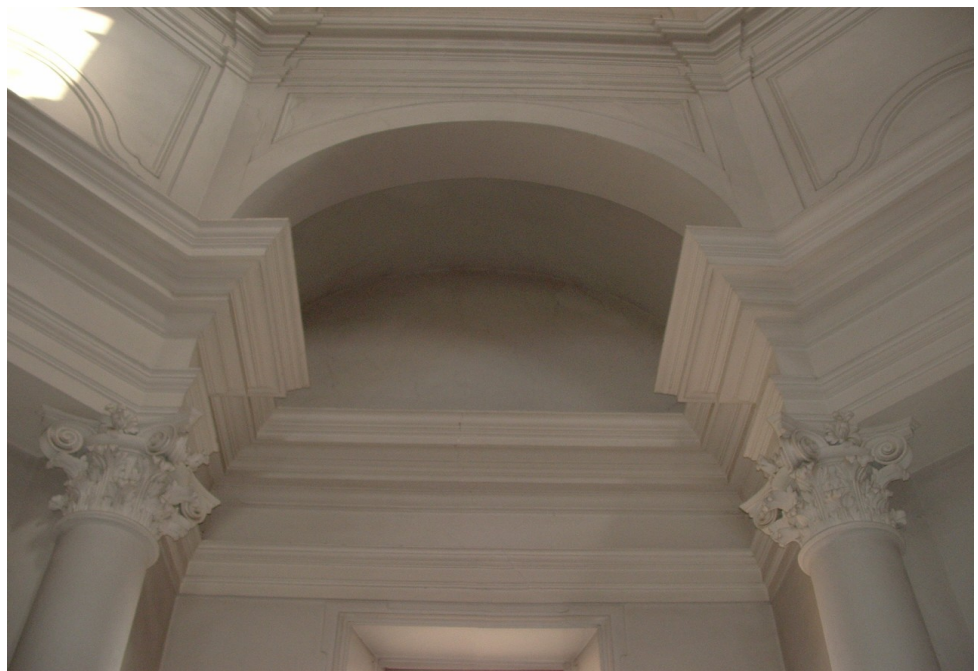
Vista interna del Santuario