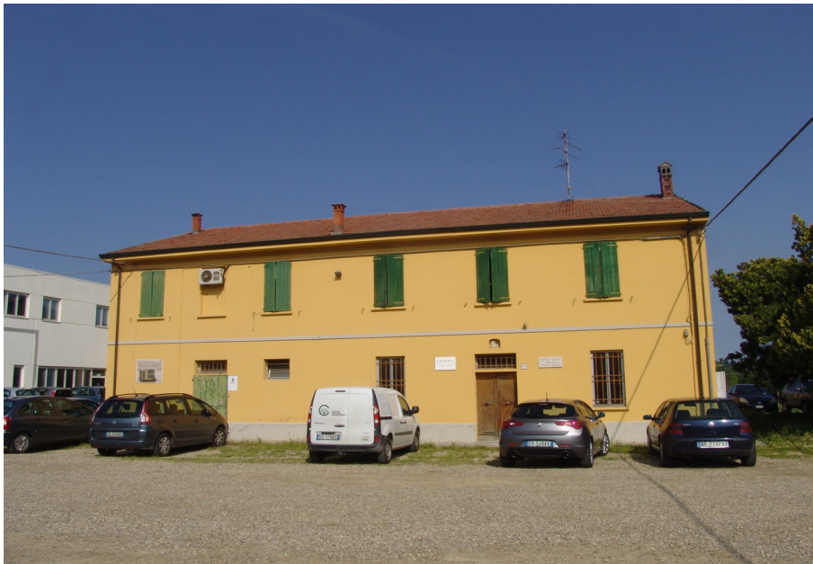
via Tebano, 45