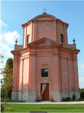
Santuario della Madonna della Salute, Solarolo (RA)