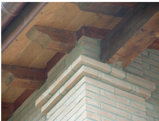
Dettaglio Colonna-Copertura, villa unifamiliare Faenza (RA)