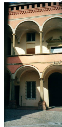
Palazzo Ginnasi, corte, Castelbolognese (RA)