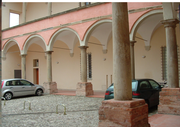
Palazzo Ginnasi, Castelbolgnese (RA)