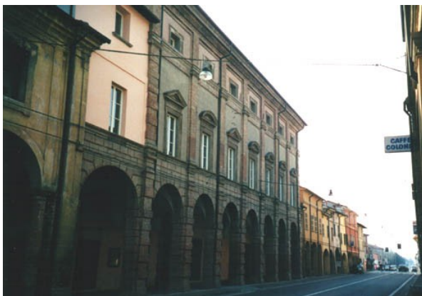
Palazzo Ginnasi, Castelbolognese (RA)

Tutte le prestazioni descritte possono essere integrate di redazione di computo metrici e capitolati d'appalto, indizione di gara di appalto anche ai sensi dell D.L. 163/2006 -Codice degli appalti pubblici-, direzione dei lavori, contabilità di cantiere, assistenza al collaudo e liquidazione.